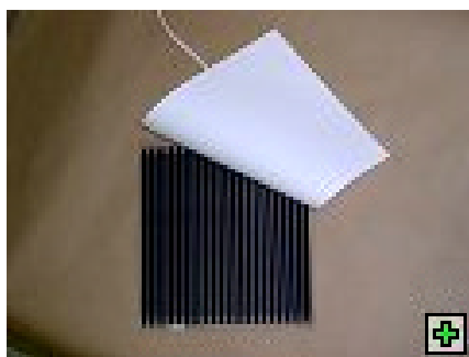
Comfort Folia strona przednia

Instrukcja ta powinna być przestrzegana razem z instrukcją producenta lustera.