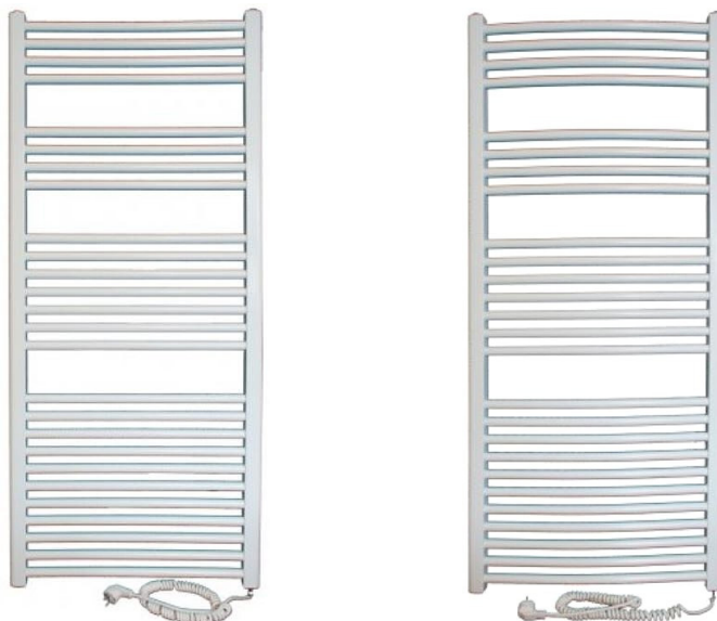
TABELA DOBORU – KD-E / KDO-E

Elektryczne grzejniki drabinkowe o profilu płaskim (KD-E) lub zaokrąglonym/łukowym (KDO-E) wypełnione niezamarzającym płynem. Przeznaczone do ogrzewania pomieszczeń wilgotnych typu łazienki, toalety oraz suszenia ręczników. Montaż pionowo na ścianie z przewodem zasilającym na dole grzejnika. Uchwyty montażowe dostarczane w komplecie z grzejnikiem. Wersja KD-E może być obracana w osi pionowej oferując lokalizację przewodu zasilającego z lewej lub prawej strony grzejnika. Wbudowany bezpiecznik termiczny. Kolor biały RAL 9016. Spiralny przewód zasilający 1m (max. rozciągnięcie do 3,5m) zakończony wtyczką. Zasilanie napięciem 230V AC.